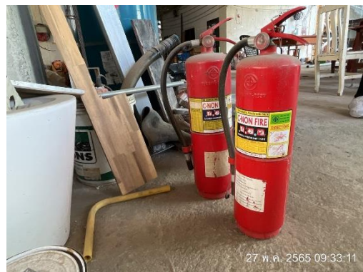
ภาพที่ 35 ถังดับเพลิงเคมี