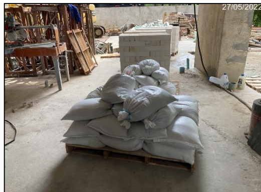
ภาพที่ 1 พื้นที่กองวัสดุ